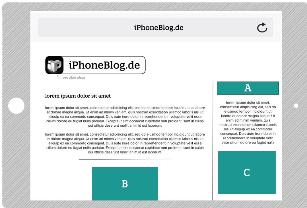
Ansicht: iPad quer / Webbrowser