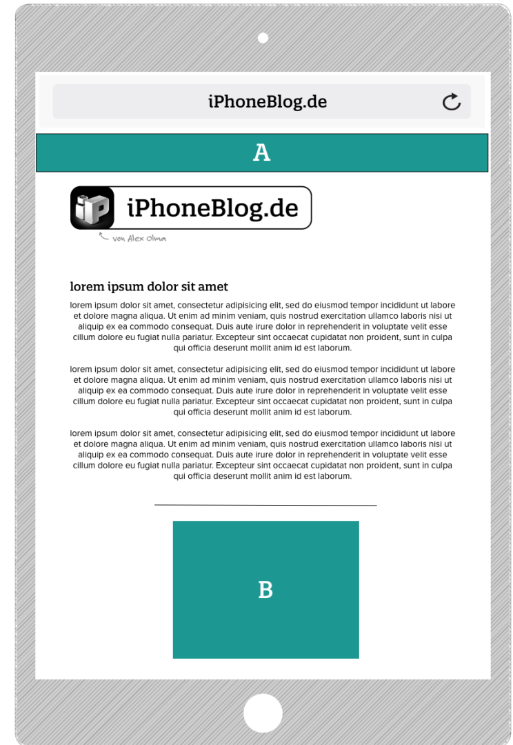
Ansicht: iPhone und iPad hochkant